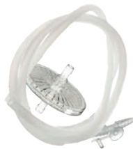
Silikonschlauchset, Art.-Nr.: 033-04820